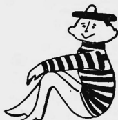
Mr. Heads N. Threads

Schraubenmutter, Bolzen, Schrauben, Unterlagsscheiben, Verbindungsstücke mit Schraubengewinden, Nägel, Stifte, Reissnägel, Niete und Stiftschrauben.