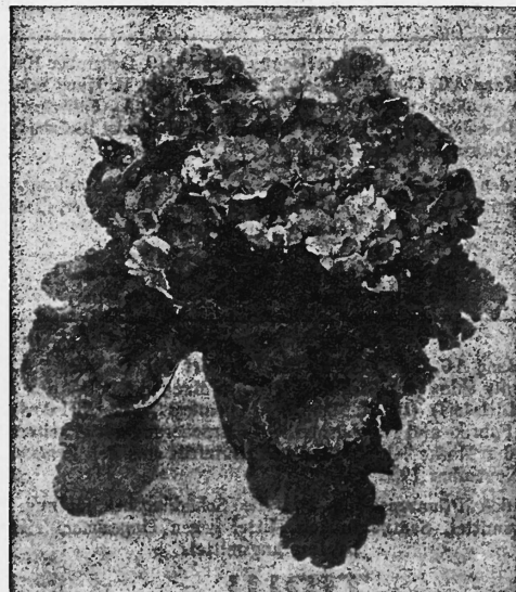
« PERLE CHÉNOISE » PRIMEVÈRE OBCONIQUE