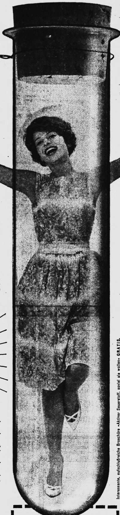
Interessante, aufschlussreiche Broschüre - Aktiver Sauerstoff, sowie alle wollen - GRATIS.

IKS Nr. 22226 Export: Intertrade AG, Zürich 22 Copyright A. S. G. 21/60