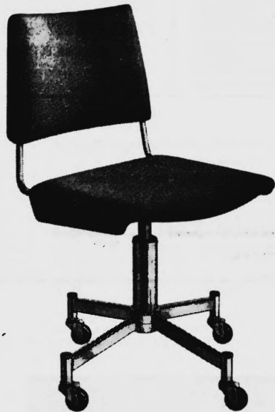
Albert Stoll, Giroflex Stuhlfabrik, Koblenz/AG

40 weitere GIROFLEX — vom einfachsten bis zum Luxusmodell. In Büromöbel-Fachgeschäften erhältlich.