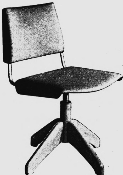
Albert Stoll, Giroflex Stuhlfabrik, Koblenz/AG

40 weitere GIROFLEX — vom einfachsten bis zum Luxusmodell. In Büromöbel-Fachgeschäften erhältlich.