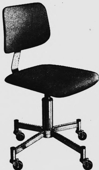
Albert Stoll, Giroflex Stuhlfabrik, Koblenz/AG

Darum wünschen Sie einen Stuhl, der sich Ihrer Arbeit anpasst: mit einer verstellbaren Rückenlehne, die Sie vom Sitz aus bequem auf jede Position einstellen können. Als fester Halt — oder als beweglich federnde Rückenstütze.