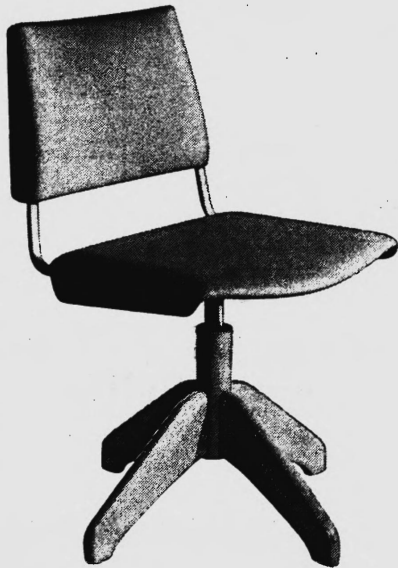
Albert Stoll, Giroflex Stuhlfabrik, Koblenz/AG

40 weitere GIROFLEX — vom einfachsten bis zum Luxusmodell. In Büromöbel-Fachgeschäften erhältlich.