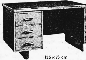
125 x 75 cm