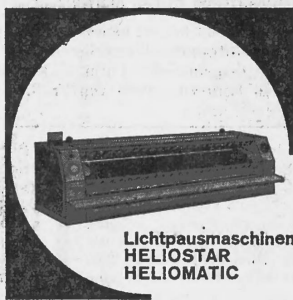
Lichtpausmaschinen HELIOSTAR HELIOMATIC

Verlangen Sie vom SHAB. unentgeltliche Zusendung von Probenummern der Monatsschrift «Die Volkswirtschaft»