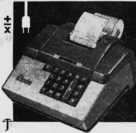
Comptoir, Halle 7, Stand 751

Dépositaires PRECISA dans toute la Suisse Fabrique à Zurich-Oerlikon