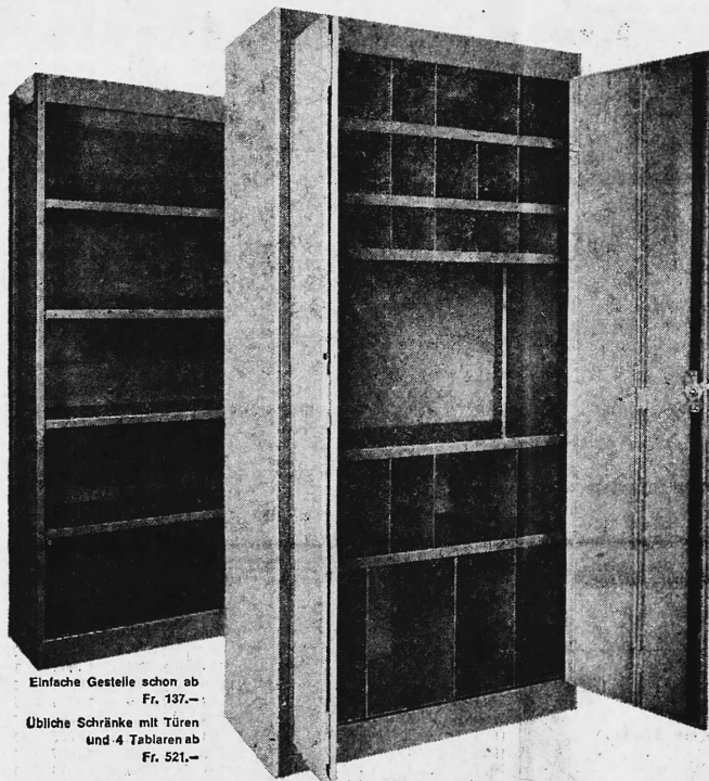
Einfache Gestelle schon ab Fr. 137.—