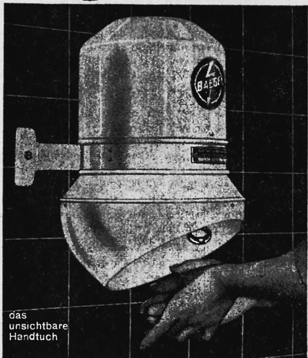
das unsichtbare Handtuch

Mit dem Baege-Händetrockner nie mehr schmutzige und zerrissene Handtücher.