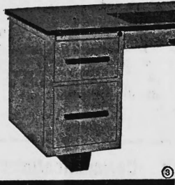
Pultsockel Typ 54 M

Verlangen Sie Prospekte und Bezugsquellennachweis