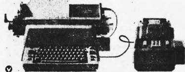
Muba, Halle 25, Stand 8655