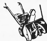
Schneescheuder Mod. 80