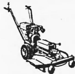
Horizontalmäher Mod. 28

mit wenigen Handgriffen an den 6-PS-Traktor montierbar