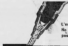
L'encre Jax No 1 n'est pas toxique

3 km d'écriture. Jax No 1 contient 3 fois plus d'encre liquide que les flacons remplis surtout d'ouate saturée d'encre.