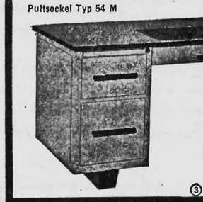
Pultsockel Typ 54 M Verlangen Sie Prospekt und Bezugsquellennachweis