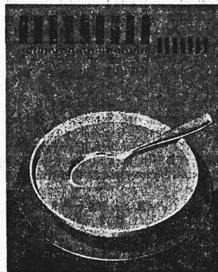
La marque est exécutée en jaune et rouge.