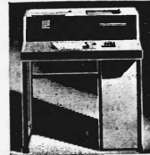
Preiskategorien von Fr. 2450.- bis ca. Fr. 150 000.-

Datenerfassungsgeräte in Off-line-Techniken mit Lochkarten, Lochstreifen und optisch lesbaren Schriften. On-line-Terminals für Simplex- und Duplex-Verkehr mit EDV-Anlagen beliebiger Provenienz.