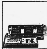
Preiskategorien von Fr. 6100.- bis ca. Fr. 98 000.-

Buchungsautomaten verschiedener Baureihen elektromechanischer und elektronischer Konstruktion mit 2-4 Grundoperationen, 2 - 256 Rechenwerken bzw. Speichern, Volltext oder Kurztext, von der einfachen Vorsteckeinrichtung über den photoelektrischen Kontoeinzug bis zur automatischen Saldolesung mit Magnetkonten, Anschluss von Karten- und Streifenlochern.