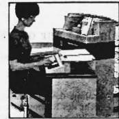
Preiskategorien von Fr. 72 200.- bis ca. Fr. 500 000.-

Leistungsfähige Computer der dritten Generation für die mittlere Datentechnik. Kernspeicherkapazität von 4 - 16 K. Programm- sowie Daten-Ein- und -Ausgabe mit Kassettenmagnetband, alphanumerischer Blockdrucker mit einer Geschwindigkeit von 50-60 Zeichen pro Sekunde. Mit und ohne Magnetkonto-Verarbeitung: Speicherkapazität pro Kontoseite 400 alphanumerische Stellen (800 je Kontoblatt). Volle Integration des Datenflusses durch Peripherie-Geräte.