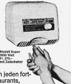
Modell Super 1650 Watt Fr. 270.- mit Zeitschalter

Baege-Trockner trocknen angenehm, schnell und gründlich (von zwei Seiten intensiver Warmluftstrom). Einfache Bedienung: Ein Knopfdruck genügt, 40 Sekunden lang zirkuliert sympathisch temperierte Luft. Fertig. Kein Ärger mehr mit zerrissenen, schmutzigen Handtüchern. Weitere Vorteile sprechen für Baege-Trockner: praktisch unbeschränkte Lebensdauer (Spezialmotor mit Dauerschmierung auf Kugellagern). Thermoschutz (kein Überhitzen möglich). Robustes Stahlgehäuse. Geringe Betriebskosten. Kleiner Preis. Baege-Trockner sind SEV-geprüft, geräuscharm und platzsparend.