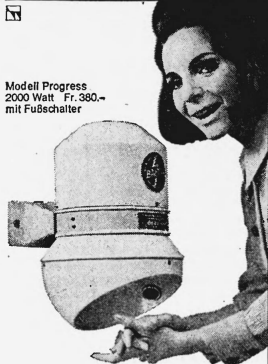
Modell Progress 2000 Watt Fr. 380.- mit Fußschalter

Baege-Trockner trocknen angenehm, schnell und gründlich (von zwei Seiten intensiver Warmluftstrom). Einfache Bedienung: Ein Knopfdruck genügt, 40 Sekunden lang zirkuliert sympathisch temperierte Luft. Fertig. Kein Ärger mehr mit zerrissenen, schmutzigen Handtüchern. Weitere Vorteile sprechen für Baege-Trockner: praktisch unbeschränkte Lebensdauer (Spezialmotor mit Dauerschmierung auf Kugellagern). Thermoschutz (kein Überhitzen möglich). Robustes Stahlgehäuse. Geringe Betriebskosten. Kleiner Preis. Baege-Trockner sind SEV-geprüft, geräuscharm und platzsparend.