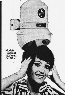
Modell Progress 1200 Watt Fr. 340.-

Baege-Händetrockner gehören in jeden fortschrittlichen Betrieb: Cafés, Restaurants, Hotels, Büros, Fabriken, Spitäler, Sanatorien, Warenhäuser, Kinos, Theater, Tankstellen usw. Baege-Haartrockner , beliebt und bewährt in Sportstätten, Bädern, Schwimmhallen, Douchen-Anlagen usw.