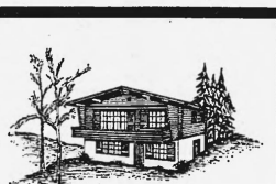
Die beste Kapitalanlage ist die Sorge um Ihre Gesundheit!

Solvente Interessenten wollen ihre Eilofferte einreichen unter Chiffre E 25-51 450 an Publicitas AG, 6002 Luzern.