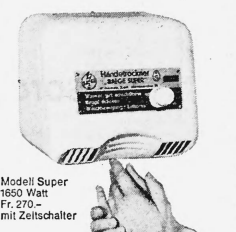
Modell Super 1650 Watt Fr. 270.— mit Zeitschalter

Weitere Vorteile sprechen für Baege-Trockner: praktisch unbeschränkte Lebensdauer (Spezialmotor mit Dauerschmierung auf Kugellagern). Thermoschutz (kein Überhitzen möglich). Robustes Stahlgehäuse. Geringe Betriebskosten. Kleiner Preis. Baege-Trockner sind SEV-geprüft, geräuscharm und platzsparend.