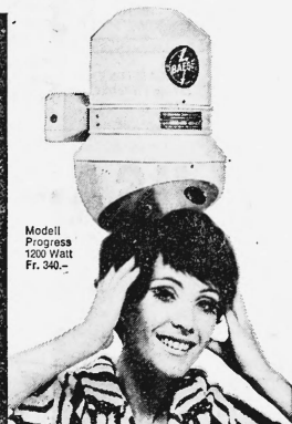
Modell Progress 1200 Watt Fr. 340.—

Baege-Händetrockner gehören in jeden fortschrittlichen Betrieb: Cafés, Restaurants, Hotels, Büros, Fabriken, Spitäler, Sanatorien, Warenhäuser, Kinos, Theater, Tankstellen usw.