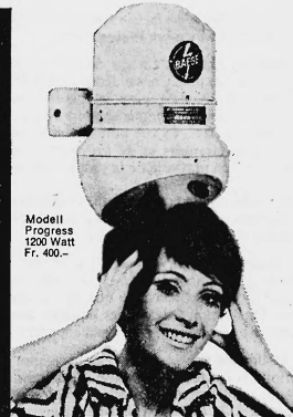
Modell Progress 1200 Watt Fr. 400.-

Baege-Händetrockner gehören in jeden fortschrittlichen Betrieb: Cafés, Restaurants, Hotels, Büros, Fabriken, Spitäler, Sanatorien, Warenhäuser, Kinos, Theater, Tankstellen usw. Baege-Haartrockner, beliebt und bewährt in Sportstätten, Bädern, Schwimmhallen, Douchen-Anlagen usw.