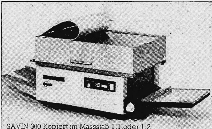
SAVIN 300 Kopiert im Massstab 1:1 oder 1:2