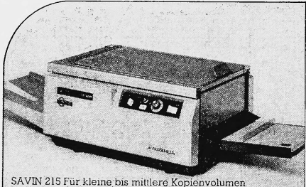
SAVIN 215 Für kleine bis mittlere Kopiermengen

Einer unserer SAVIN-Kopierapparate entspricht auch Ihren Anforderungen.