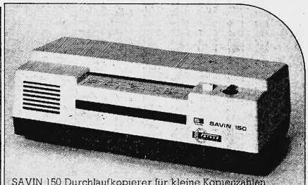
SAVIN 150 Durchlaufkopierer für kleine Kopiermengen