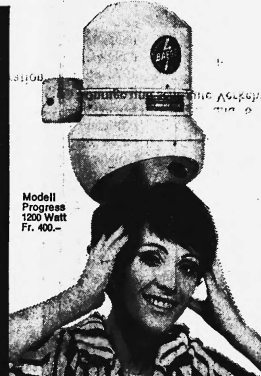
Modell Progress 1200 Watt Fr. 400.-

Baegé-Händetrockner gehören in jeden fortschrittlichen Betrieb: Cafés, Restaurants, Hotels, Büros, Fabriken, Spitäler, Sanatorien, Warenhäuser, Kinos, Theater, Tankstellen usw. Baegé-Haartrockner , beliebt und bewährt in Sportstätten, Bädern, Schwimmhallen, Douchen-Anlagen usw.