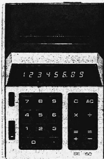
Modell SE - 60 Fr. 675.—