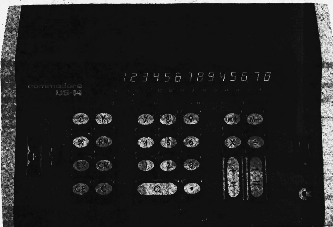
Modell COMMODORE US-14

Der brandneue preiswerte commodore -Allesrechner ist aus USA eingetroffen