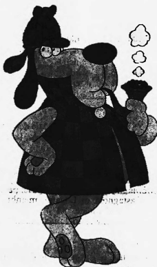
Inspektor Sniff von Credo

Kosmetika und andere Mittel zur Körper- und Schönheitspflege jeder Art, wie Oele und Salben, Pomaden, Puder, Sprays, Färbemittel, Seifen; Parfümerien, Schminken und Abschminkmittel, Badepräparate, Badesätze, Haarpflegemittel wie Haaröl und Haarwasser; Zahnpfutzmittel (Int. Kl. 3)