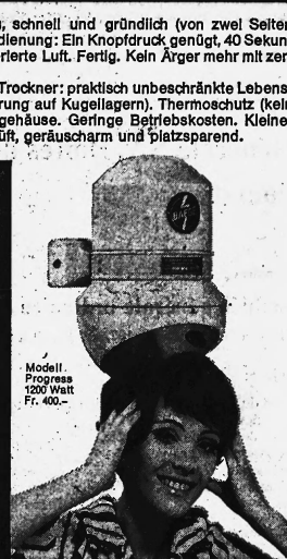
Modell Progress 1200 Watt Fr. 400.-

Baege-Händetrockner gehören in jeden fortschrittlichen Betrieb: Cafés, Restaurants, Hotels, Büros, Fabriken, Späler, Sanatorien, Warenhäuser, Kinos, Theater, Tankstellen usw. Baege-Haartrockner , beliebt und bewährt in Sportsstätten, Bädern, Schwimmhallen, Douchen-Anlagen usw.