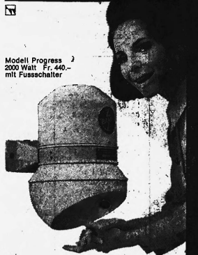
Modell Progress 2 2000 Watt Fr. 440.- mit Fusschalter