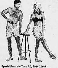
Spezialdienst der Tono AG, 8034 Zürich