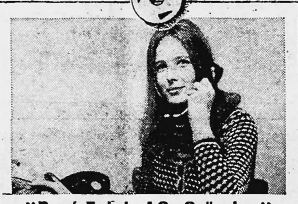
„René Faigle AG, Grüezi...“

Deshalb informieren wir Sie an dieser Stelle nicht nur über unsere verschiedenen Produkte, über unser gesamtes Sortiment an wirtschaftlichen und leistungsfähigen Geräten, service und unseren Reparatur - Schnelldienst, sondern auch über Neuentwicklungen auf dem Gebiet des Rechnens, Schreibens und Kopierens, über Occasionen - kurz: über alles, was Sie interessieren kann. Seit über 35 Jahren sind wir auf diesem Gebiet tätig. Die Erfahrung lehrt uns: Nur durch qualitativ hochstehende, preisgünstige Produkte, nur durch die Heranbildung erstklassiger Fachleute - und durch objektive Information können wir unseren Kunden dienen.