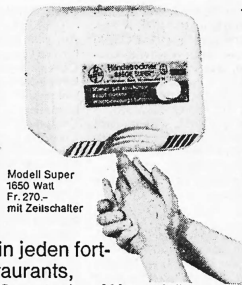
Modell Super 1650 Watt Fr. 270.— mit Zeitschalter

Baege-Trockner trocknen angenehm, schnell und gründlich (von zwei Seiten intensiver Wärmeluftstrom). Einfache Bedienung: Ein Knopfdruck genügt, 40 Sekunden lang zirkuliert sympathisch temperierte Luft. Fertig. Kein Ärger mehr mit zerrissenen, schmutzigen Handtüchern. Weitere Vorteile sprechen für Baege-Trockner: praktisch unbeschränkte Lebensdauer (Spezialmotor mit Dauerschmierung auf Kugellagern). Thermoschutz (kein Überhitzen möglich). Robustes Stahlgehäuse. Geringe Betriebskosten. Kleiner Preis. Baege-Trockner sind SEV-geprüft, geräuscharm und platzsparend.