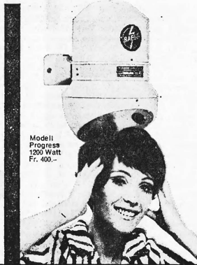
Modell Progress 1200 Watt Fr. 400.—