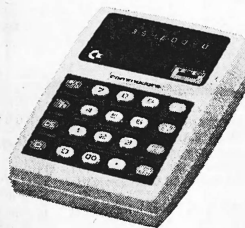
MM-3-P (%-Automatik) Fr. 295.—