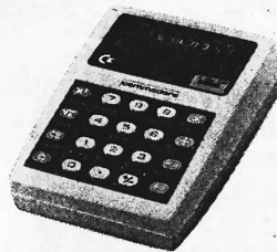
MM-3-S (Wurzelautomatik) Fr. 295.—