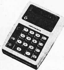
MM-3 Fr. 245.—