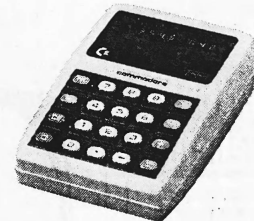
MM-3-M (Speicher) Fr. 345.—