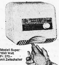
Modell Super 1650 Watt Fr. 270.- mit Zeitschalter