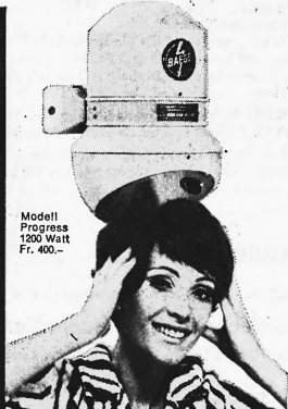
Modell Progress 1200 Watt Fr. 400.-

Baege-Händetrockner gehören in jeden fortschrittlichen Betrieb: Cafés, Restaurants, Hotels, Büros, Fabriken, Spitäler, Sanatorien, Warenhäuser, Kinos, Theater, Tankstellen usw. Baege-Haartrockner, beliebt und bewährt in Sportstätten, Bädern, Schwimmhallen, Douchen-Anlagen usw.