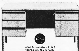
4000 Schreibtisch ELWE 140/85 cm, 78 cm hoch

Das ELWE-Schreibtischsortiment reicht vom Minipult bis zum Managerschreibtisch. Wir führen über 50 Modelle.