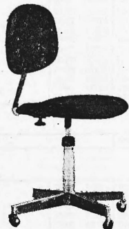
Chaise secrétaire, réglable revêtement simili