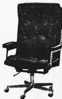
Fauteuil direction, tout cuir régulation à gaz