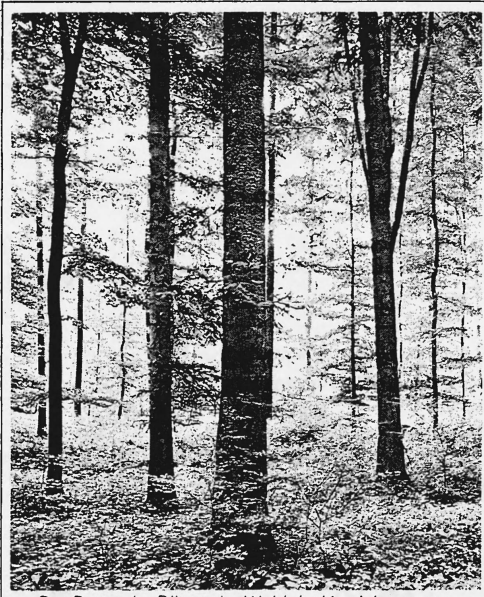
Der Baum der Bäume im Wald der Versicherungen.

Sind Sie sicher, dass Ihre Kollektiv-Krankenversicherung Ihrem Unternehmen oder Ihrem Berufsverband das Beste für Ihr Geld bietet? Vergleichen Sie!