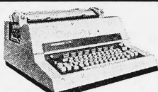
Hermes 700 EL. Die perfekte elektrische Schreibmaschine für die Sekretärin. Jetzt noch perfekter, mit eingebauter Korrekturtaste.

Ein sehr guter Grund mehr, eine der vielseitigen, komfortablen und vor allem unerhört robusten und dauerhaften Hermes-Schreibmaschinen anzuschaffen. Schweizer-Qualität ist wieder Trumpf. Wollen Sie mehr wissen? Schicken Sie uns den Coupon.