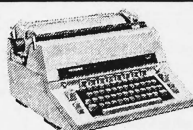
Hermes Ambassador. Die robuste Allround-Schreibmaschine mit dem einzigartigen Leistungs-/Preisverhältnis.