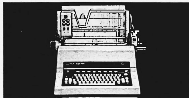
RUF-INTROMAT Die Mehrzweckbuchungs- und Korrespondenzmaschine mit automatischer Doppelformularzuleitung

Was versteht man eigentlich unter «RUF-COMPUTER — flexibel»? Ist das nur ein Reizwort ohne realen Hintergrund? Wohl kaum. Bereits beim klärenden Gespräch, wenn nämlich die zu erwartende Leistung der Anlage umrissen wird, offenbart sich die RUF-Computer-Flexibilität: durch die flexible Programmierung wird die Anlage das leisten, was der Kunde erwartet, ohne ihn mit unverlangtem Informationsausstoss zu belasten oder gar zu läh-