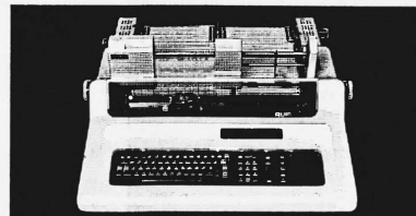
RUF-Büro-Computer mit oder ohne Magnetknoten, verschiedene Modelle; auch für kleinere Betriebe