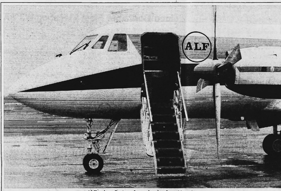
ALF verleast Business Jets und andere Investitionsgüter.