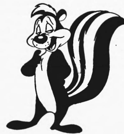
PEPE LE PEW

Hinterlegungsdatum: 24. August 1989 375304 Warner Bros. Inc. , 4000 Warner Boulevard, Burbank (CA 91522, Vereinigte Staaten von Amerika)