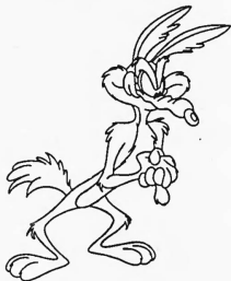
WILE E. COYOTE

Hinterlegungsdatum: 24. August 1989 375309 Warner Bros. Inc. , 4000 Warner Boulevard, Burbank (CA 91522, Vereinigte Staaten von Amerika)