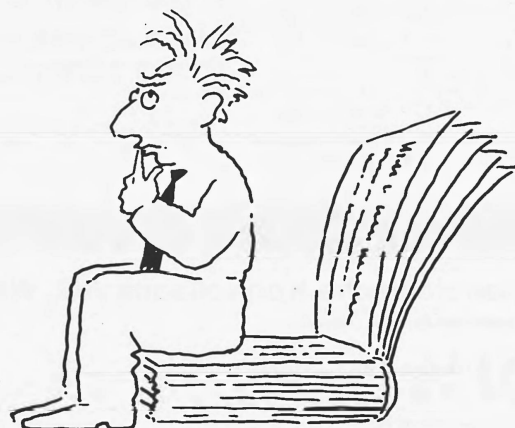
Das Kleininserat. Der ideale Platz, um für eine Fremdsprache die richtige Schulbank zu finden. Kleine Inserate. Grosse Wirkung. Publicitas.

Inhaber von Partizipationsscheinen der Jacobs Suchard AG können eine Informationsbroschüre über die vorgesehene Umstrukturierung bis spätestens 12. August 1991 am Gesellschaftssitz in Zürich beziehen.