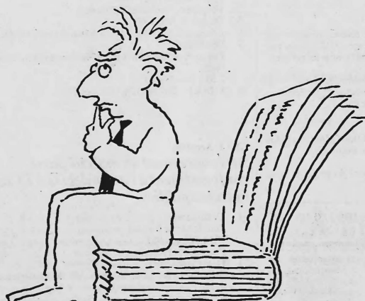
Das Kleininserat. Der ideale Platz, um für eine Fremdsprache die richtige Schulbank zu finden. Kleine Inserate. Grosse Wirkung. Publicitas.