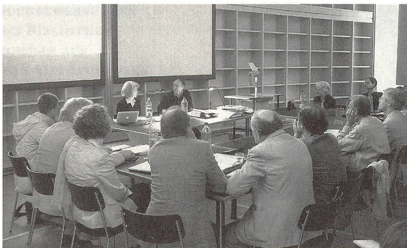
Im Lesesaal der Bibliothek während des Internationalen Barocksommerskurses 2005, Stiftung Bibliothek Werner Oechslin, Einsiedeln

Für die traditionelle Exkursion stand diesmal nur ein halber Tag zur Verfügung, was indes den Vorteil hatte, dass der Morgen für Referate und Diskussionen genutzt werden konnte. Auf der Exkursion besuchte man in der Umgebung von Einsiedeln "Orte der Religiosität". Anja Buschow Oechslin führte durch die neogotische Kirche in Bennau und die barocke Kirche in Feusisberg. Werner Oechslin erläuterte am Abend die barocke Kapelle St. Meinrad auf dem Etzel.