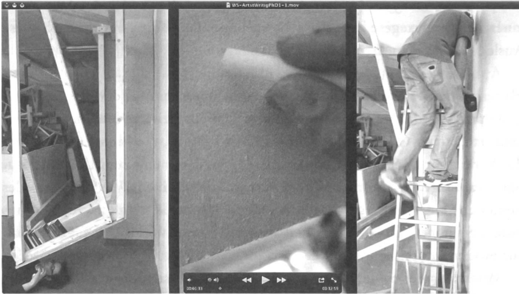
Abb. 2: Ronny Hardliz, A Portrait of the Artist writing a PhD, 2011, Videostill

untersucht wird. (Abb. 2) Als ‘Beschreiben einer Wand’ wird dem ‘Architektonischen’ nicht nur als Gegenstand, sondern auch als Diskurs begegnet, indem über und auf eine Wand geschrieben wird. Der Intuition wird bei diesem Ansatz der Erkenntnisgewinnung bewusst Raum gelassen (Wahl des Schreibmaterials, des Schreibuntergrunds, der Kleidung, des Raums, der Handlungen, der Dokumentationsmedien usw.). Die resultierenden Bilder sind trotz Werkcharakter auf jene intuitiven Entscheidungen zurückzuführen. Sie waren nicht präexistent und haben sich erst durch das Schreiben und nachträgliche Betrachten zu einer Figur verdichtet. Das Schreiben des Textes ist, wie das Stemmen des Felsens, Widerständigkeit gegen die Schwerkraft. Die Gravität wird im Gewicht des Felsens und in der Wichtigkeit des Textes ausgedrückt.