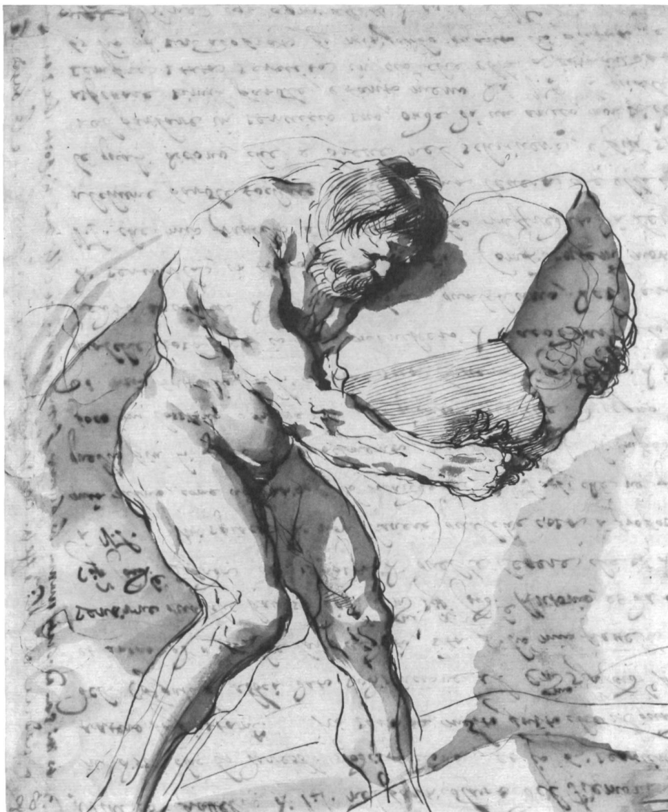
Abb. 3: Guercino (Giovanni Francesco Barbieri, 1591–1666), Sisyphos, 1636, Tusche auf Papier, 23,2 × 19,2 cm, cf. Abb. 1 und Tafel VII (The Samuel Courtauld Trust, The Courtauld Gallery, London)

Schreiben (Text) existieren im Bild als dynamische vorangehende bzw. vorgestellte Ereignisse – unabhängig von ihrem festgehaltenen Inhalt oder Ziel. Das Ereignis – das Schreiben, das Stemmen – ist dem Bild als Handlung vorgängig und kann vom Betrachter als virtuelle Erinnerungsleistung in das Bild eingebildet werden.