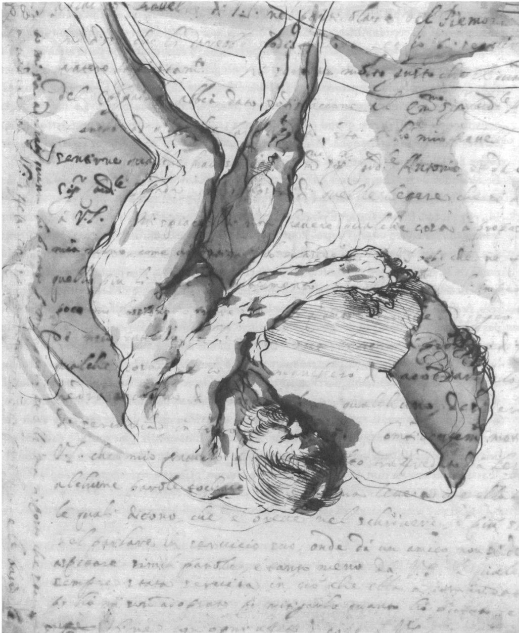
Abb. 1: Guercino (Giovanni Francesco Barbieri, 1591–1666), Sisyphos, 1636, Tusche auf Papier, 23,2 × 19,2 cm; vertikale Spiegelung des Originalscans, um die Schrift auf der Rückseite lesbar zu machen und die 'Gravitation im Bild' aufzuheben, cf. Abb. 3 und Tafel VII (The Samuel Courtauld Trust, The Courtauld Gallery, London; Spiegelung: Ronny Hardliz)