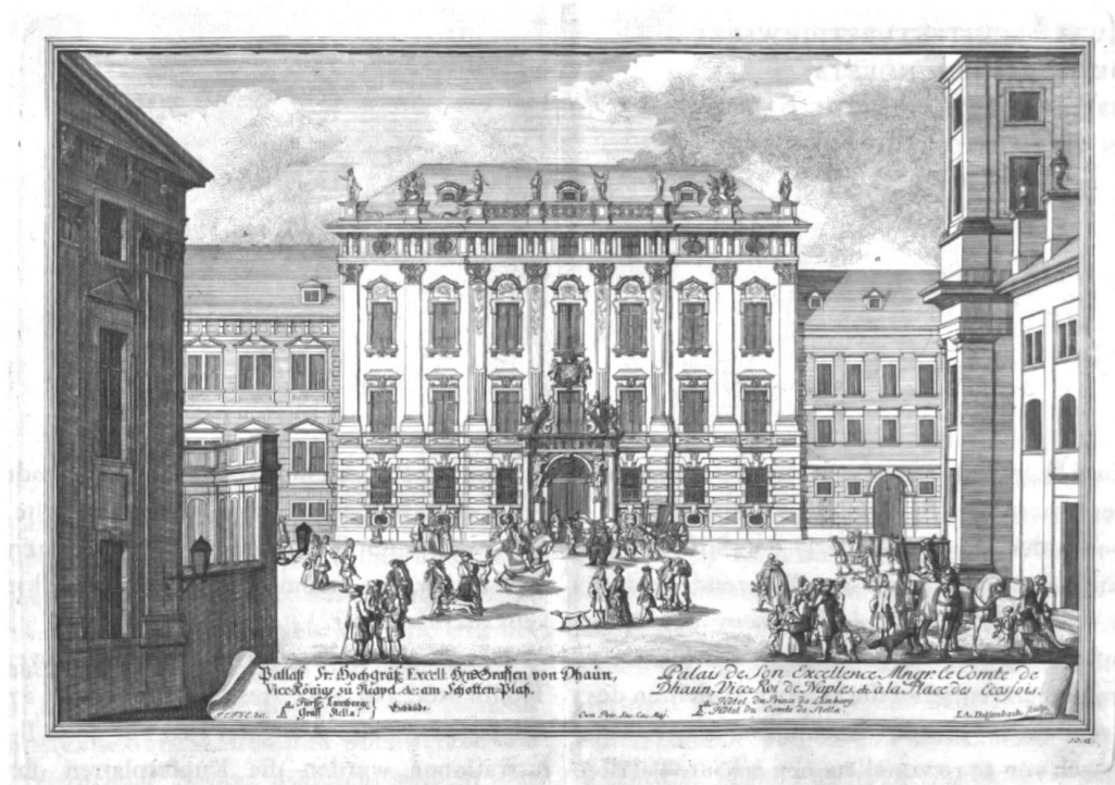
Abb. 1: Joseph Emanuel Fischer von Erlach, Anfang einiger Vorstellungen der Vornehmsten Gebäude sowohl innerhalb der Stadt als in denen Vorstädten von Wien, Wien: o. V. 1719, Taf. 10a