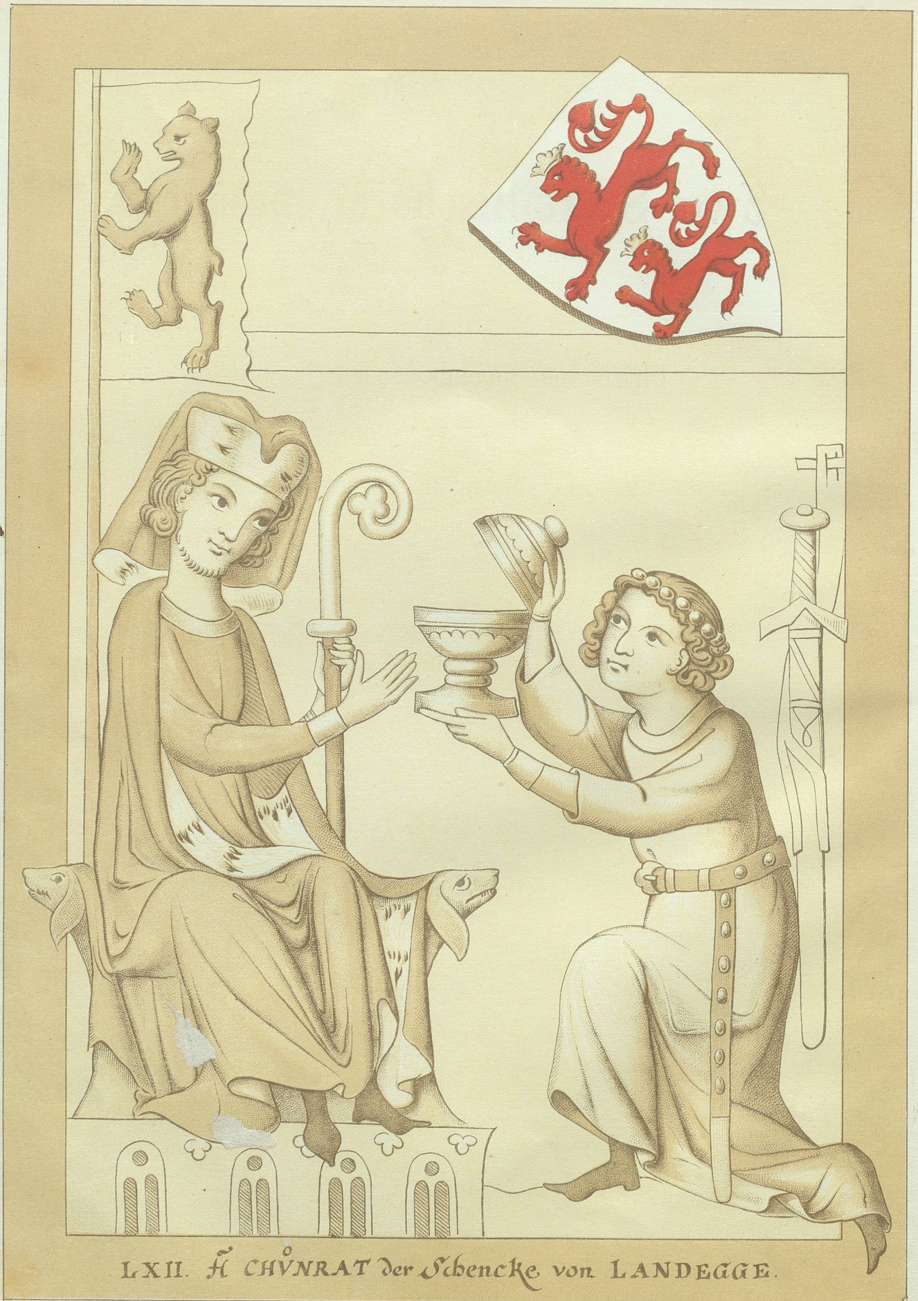
LXII. \text{H} CHVNRAT der Schencke von LANDEGGE.