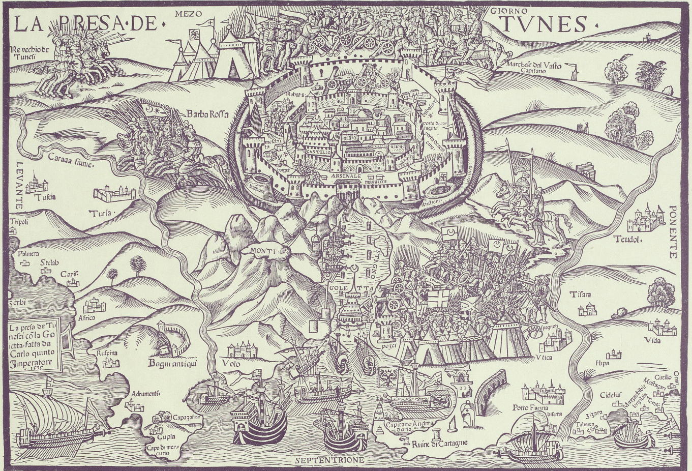
Die Eroberung von Tunis, 1535.

Nach einem gleichzeitigen Holzschnitt im Staatsarchiv Zürich.