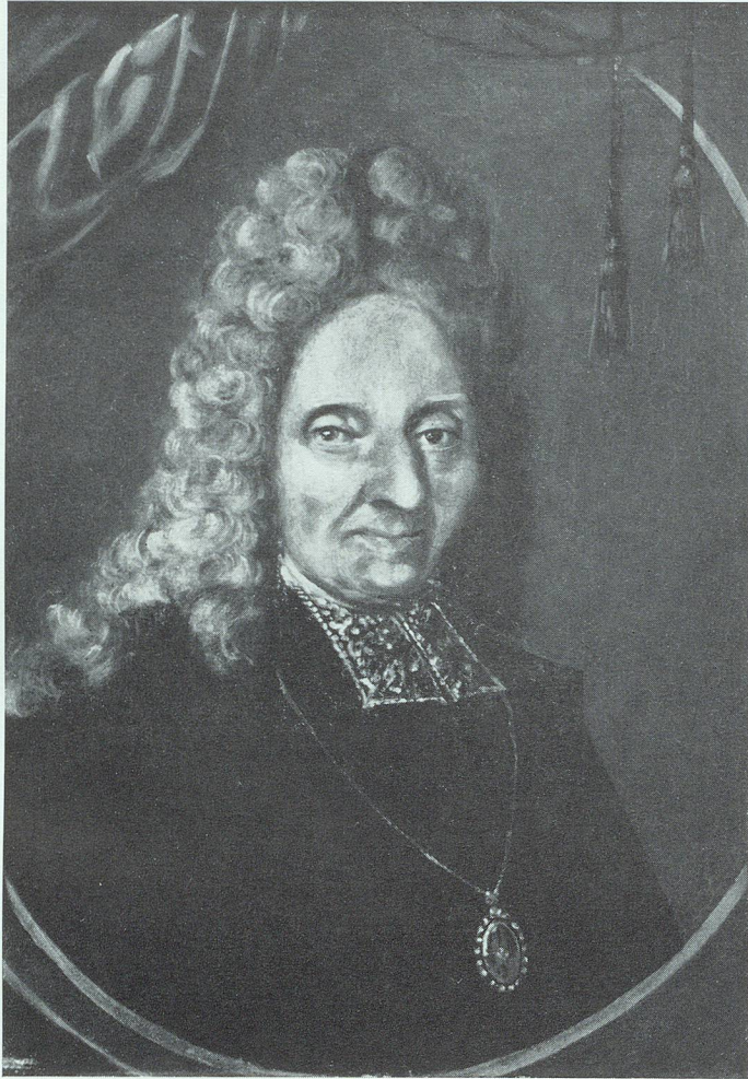
Fidel von Thurn

Nach einem Gemälde im Schloß Bruchhausen (Westfalen)