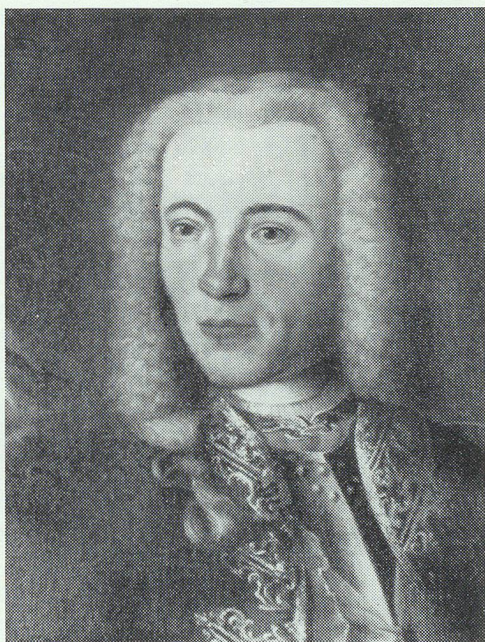
Joseph Leodegar von Thurn (1697—1759)