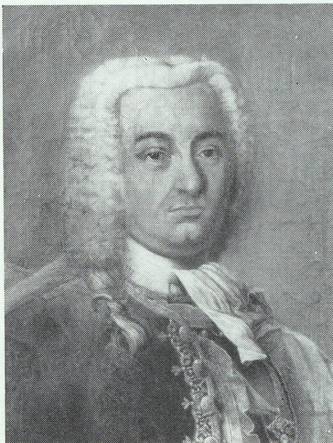
Gall Anton von Thurn (1667—1741)