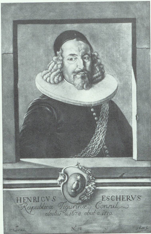
Bürgermeister Heinr. Escher von Zürich (1626—1710)